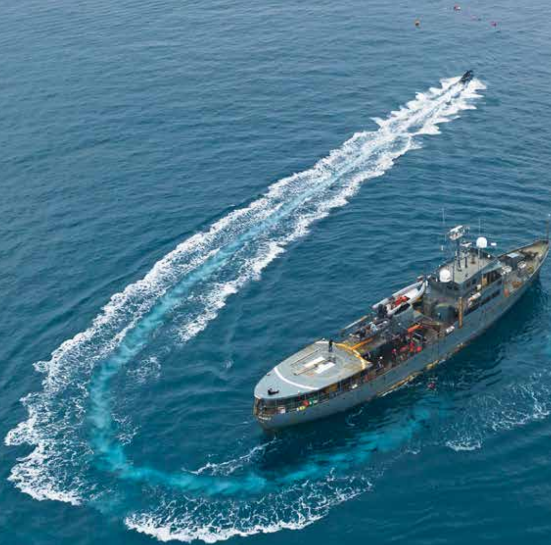
Das 60 Meter lange Expeditionsschiff Cdt. Fourcault aus der Vogelperspektive. Das Beiboot ist auf dem Weg, einen Taucher einzusammeln und zurück an Bord zu bringen.